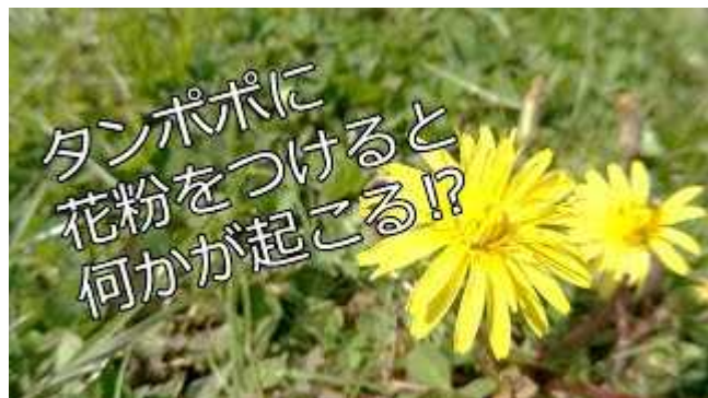
カンサイタンポポを使った簡単な受粉実験の動画です。