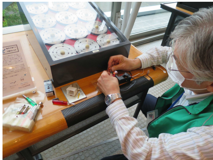
設置工事のようす