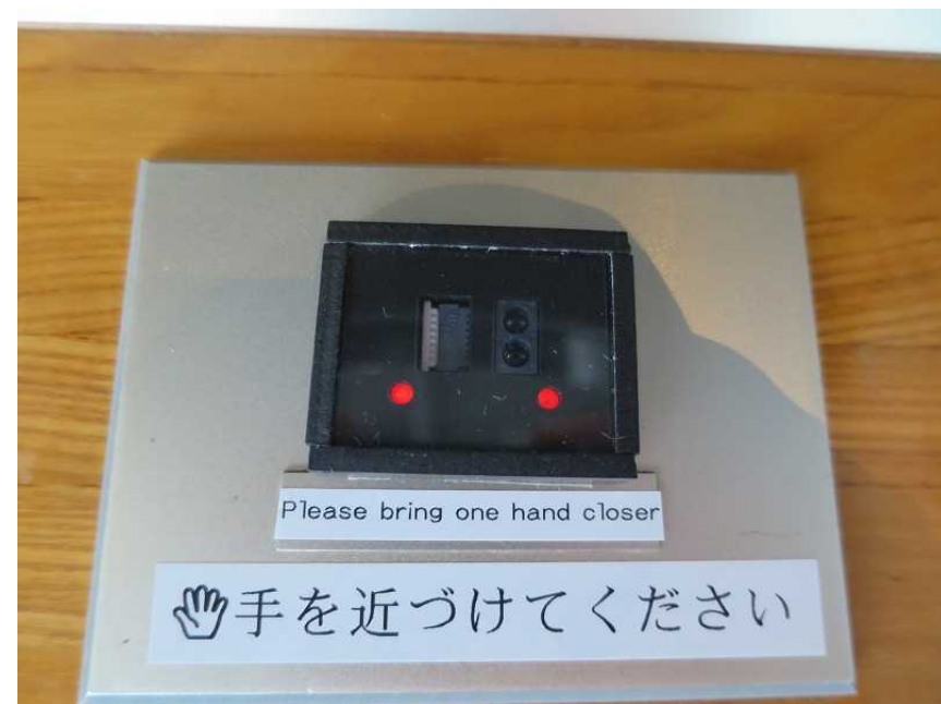
近接センサースイッチ