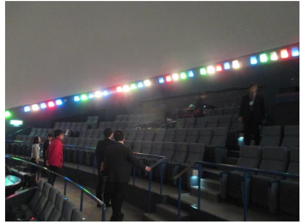
徳島県立あすたむらんど子ども科学館 プラネタリウム視察②