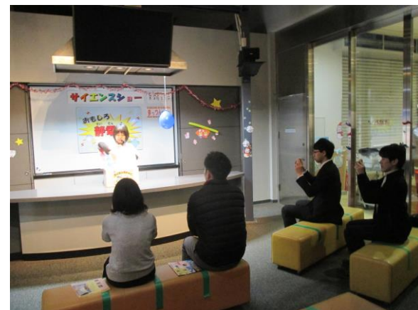
徳島県立あすたむらんど子ども科学館 サイエンスショー見学②