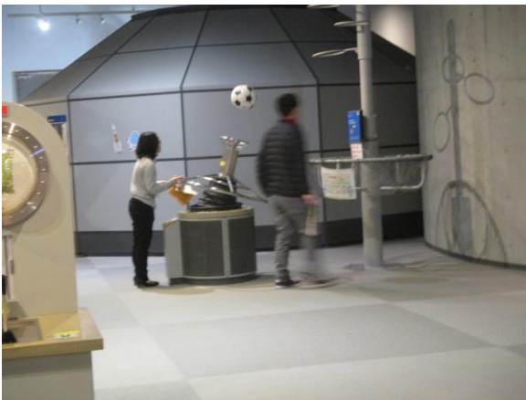
徳島県立あすたむらんど子ども科学館 常設展示場視察