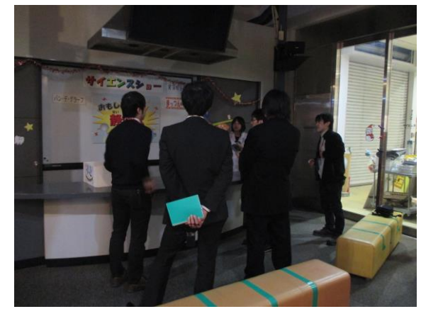
徳島県立あすたむらんど子ども科学館 サイエンスショー見学③