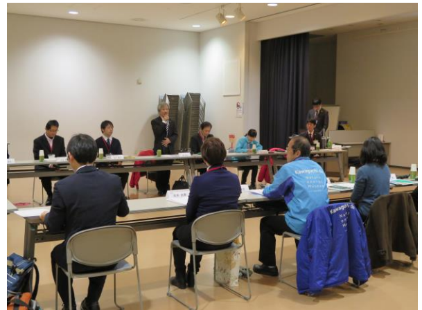
幹事館 館長 挨拶②