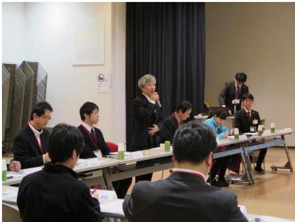
幹事館 館長 挨拶①